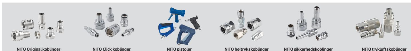
NITO Original koblinger